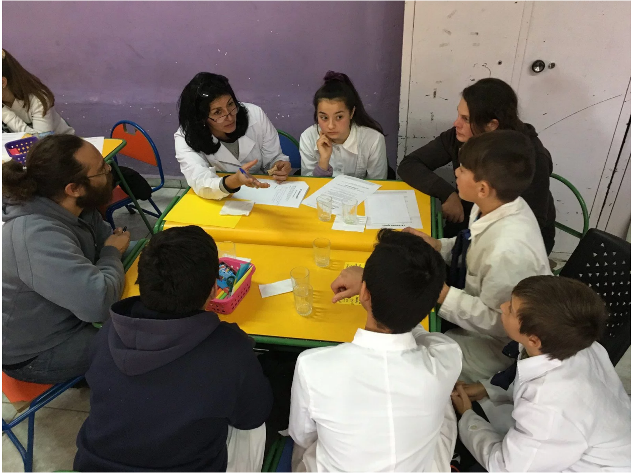
World Café #9 – Colon Sureste