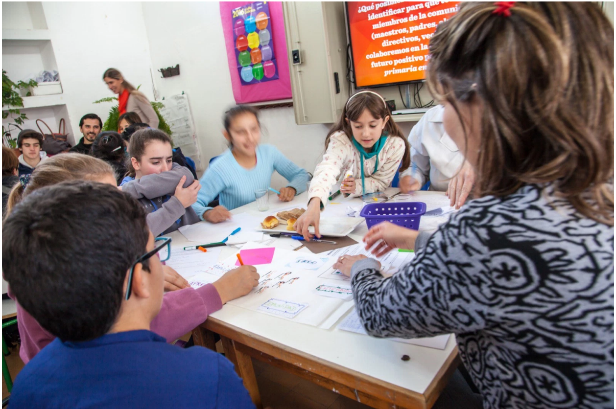
World Café #5 – San Jacinto