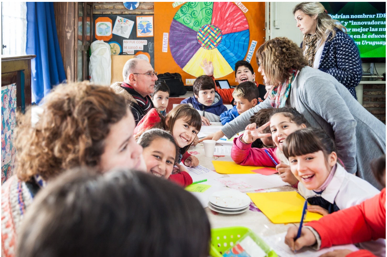
World Café #6 – La Paz