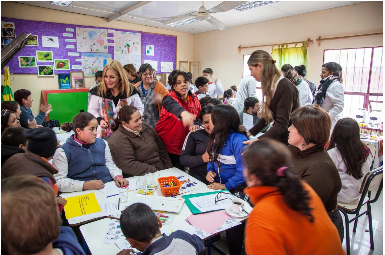
World Café #7 – Flor de Maroñas