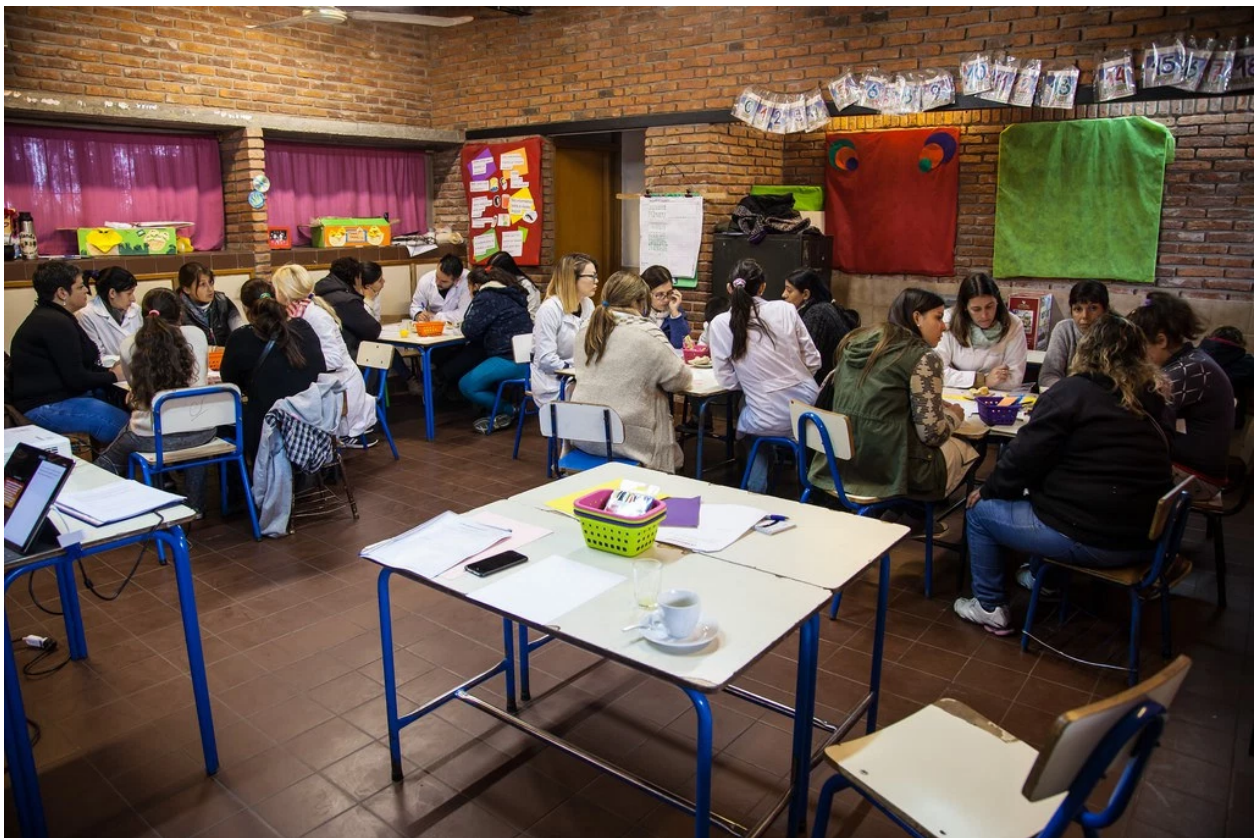
World Café #2 – Punta de Rieles