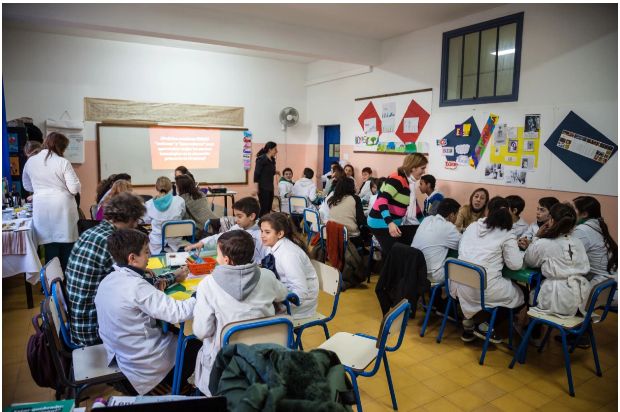
World Café #4 – Buceo