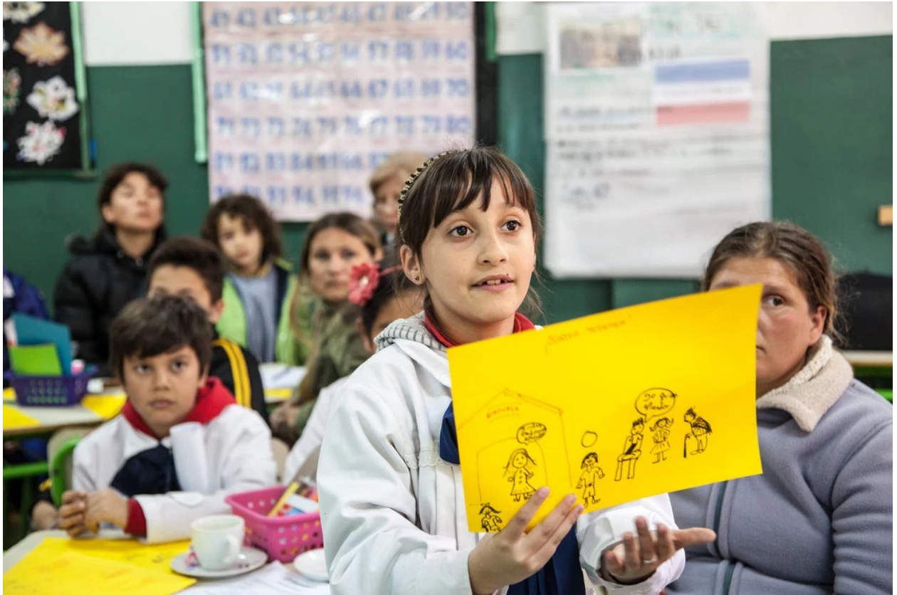
World Café #1 – Cerro Oeste