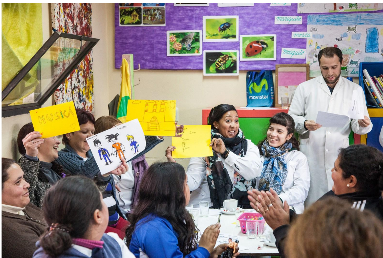
World Café #7 – Flor de Maroñas