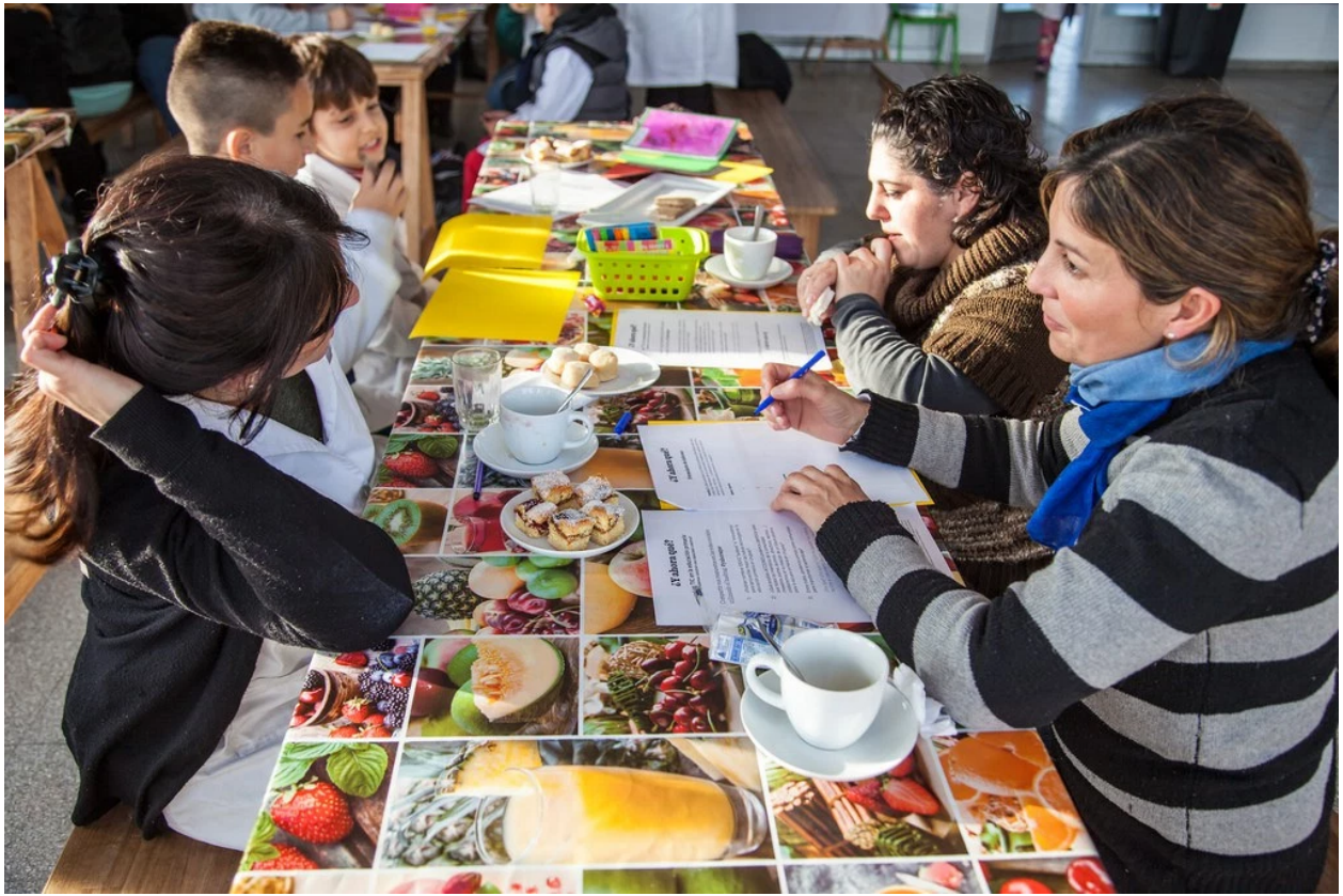
World Café #3 – Maroñas