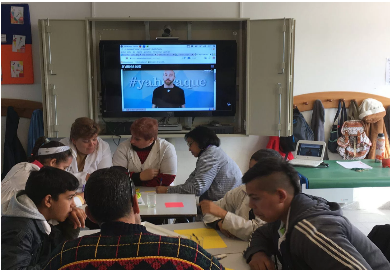
World Café #8 – Malvín Norte