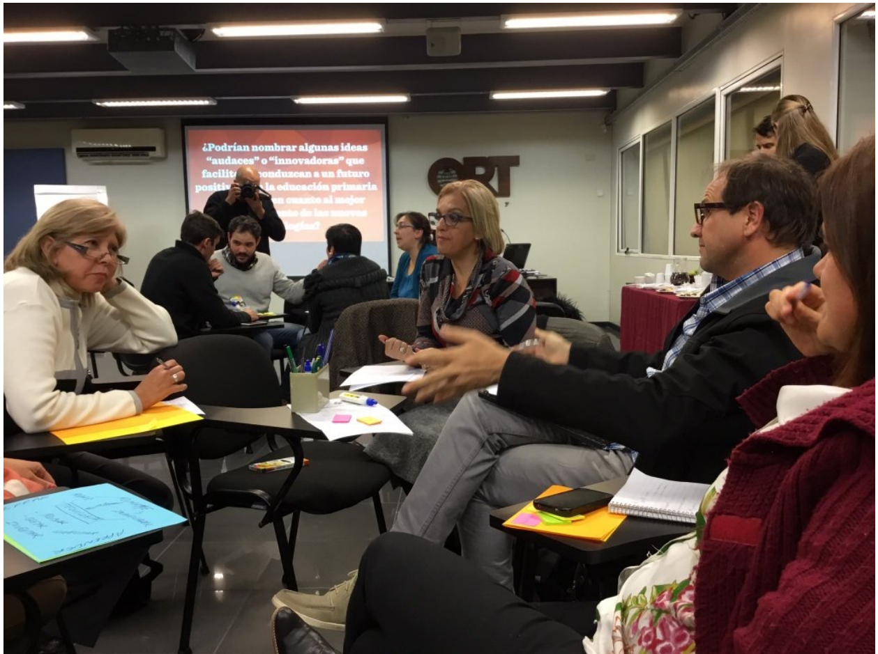
Evento de lanzamiento de proyecto